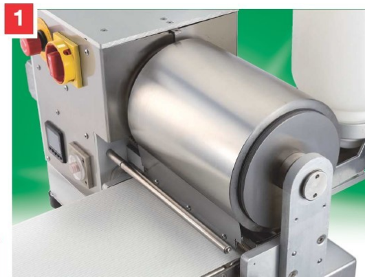
Podajniki ciasta naleśniki prostokątne 160 mm e 200 mm