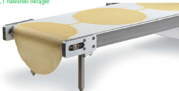
2 Bęben wypiekowy C1 naleśniki okrągłe